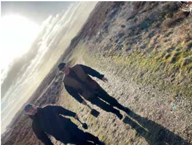
Tilbage fra sportlægning

Det var en rigtig god tur, gode opgaver, skøn mad og herlige mennesker fra hele område 3 – What´s not to like?