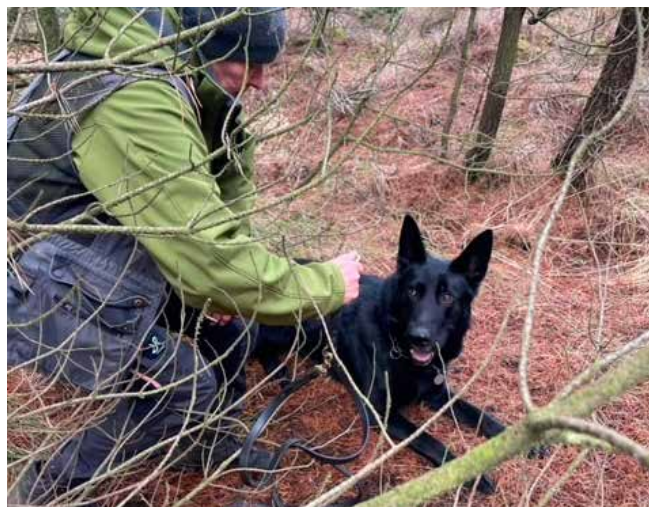
Hvad venter vi på?