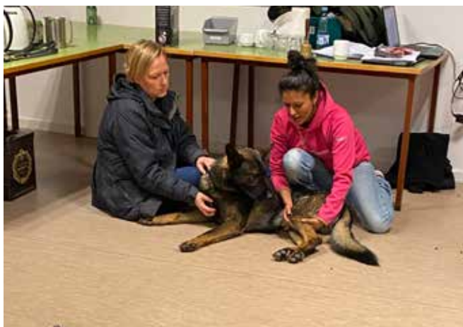
Fredag aften var der indlæg om opvarming og udstrækning af hunden.