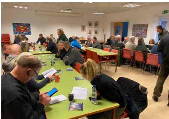
Weekendens program studeres