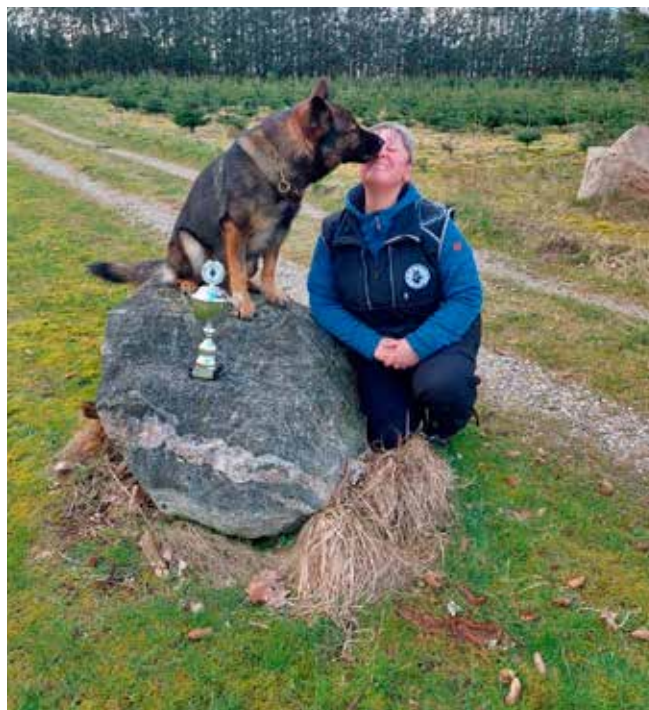
Kald det kærlighed!

Det hele kom til at koste os 3,2 p. samlet fradrag på dagen 5,5 p. Jeg var kæmpe overrasket, kæmpe lykkelig og glad, da jeg havde min hund siddende i bilen, stadig med strøm på sine batterier, ingen varme albuer udover det normale.