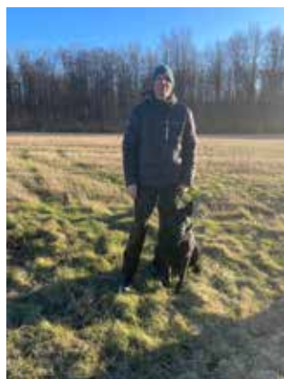
Christian og To-Fast Gambler