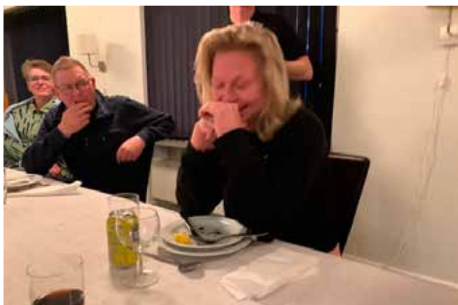
Er det MIG han snakker om??...?...

Mange mange tak til arrangørerne for et super godt arrangement. Der er kun hørt gode tilbagemeldinger. Folk & hunde var glade & trætte da de forlod Rømø. Flere stemningsbilleder fra weekenden: