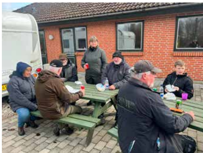
Frostpause i det fri