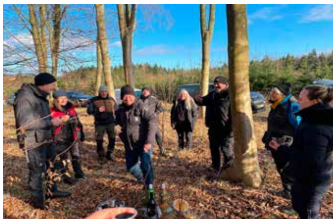
En kort formiddagspause før det rigtig går løs.

På bagkanten af Corona har der været et stort ønske i område 5 om at genoplive traditionen træningsweekend for områdets hundefører.