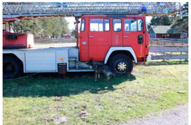
Støvlen er fundet