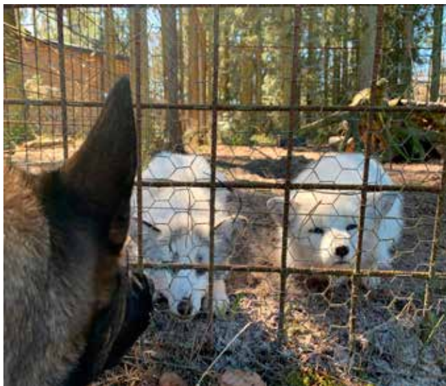
Hvor er I søde