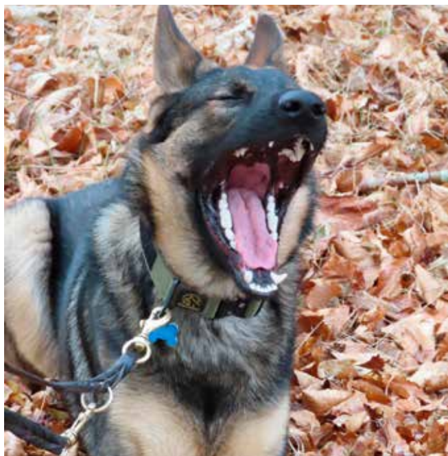
Efter en lang og krævende dag, kan man godt blive lidt træt.