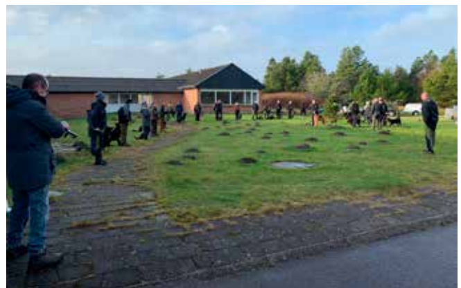
28 hunde & førere lytter godt efter og viser respekt for flaget