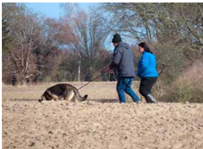
Der blev trænet spor