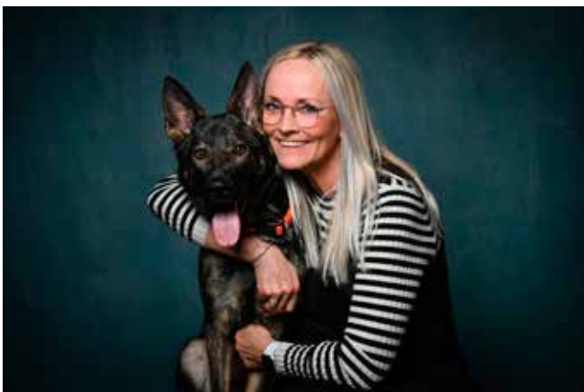
Team Sild og Weedfald Jollie Jumper

Nå men har du læst med til nu, så har du nok fået en idé om, at min hund fylder meget i min hverdag og ja, det gør hun bestemt – hun giver så mange gode oplevelser – hun er jo mors lille efternøler.