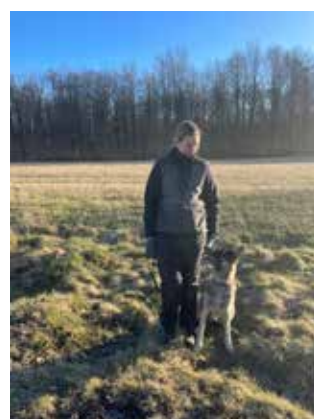
Line og Amager's Qvalli

Del 2 blev afholdt af Roskilde afdeling søndag d. 19/3.