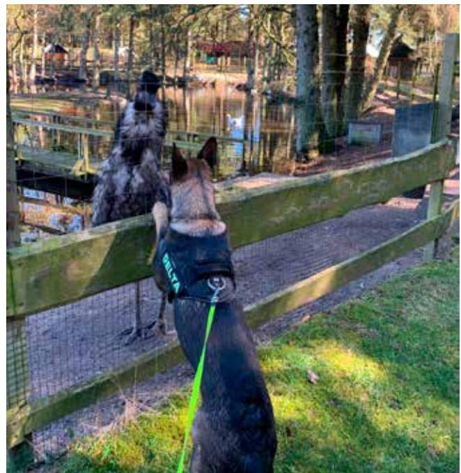
Hvem er du?

Og så sluttede vi en dejlig dag med pølser, kage og masse af solskin.