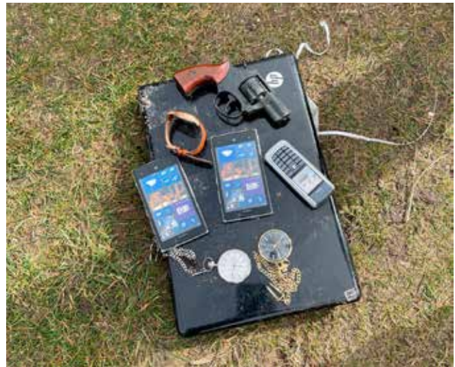
Genstande fra indbruddet