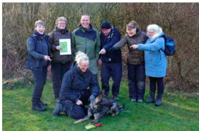
Jollie og mor siger: Tusind tak for jeres opbakning!

Vores dag i Sønderborg var fantastisk, jeg blev overbevist om, at Jolliemusens godt kan klare øvelserne 10 og 11, for på denne dag var flere parametre udskiftet; nervøsitet, udebane, ukendte figuranter- og så lige krydret med løbetid. Jeg er megastolt over vores halve, vi gjorde det sammen, mors lille bulldozer og jeg.