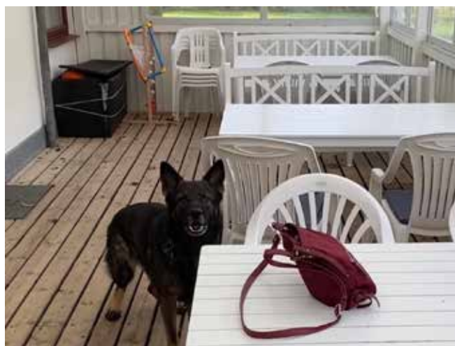
Foto efter ransugningen viser, at de nok en anden gang søger grundigt først, så jeg ikke skiller alt ad.

På vej tilbage fandt Pike kl. 0920 på et bord under halvtaget et glemte DAMETASKE med alle deres værdigenstande, som de skulle fjerne inden ransugningen. Så kunne tasken bringes til dem i sommerhuset. Kampen endte således 1 - 1.