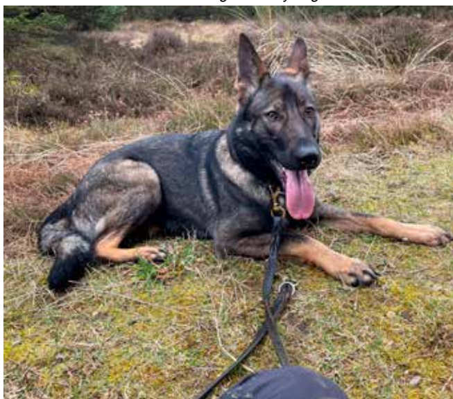
Der pustes ud