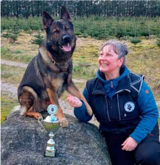
Hvem er mest stolt... Vi to gjorde det!

Jeg er dybt taknemmelig. Prikken over i ét, det blev ikke mindre end til en hel oprykning til Patrulje og tilmed en 2. plads på dagen. Et par stolte opdrættere kom der også oveni hatten.