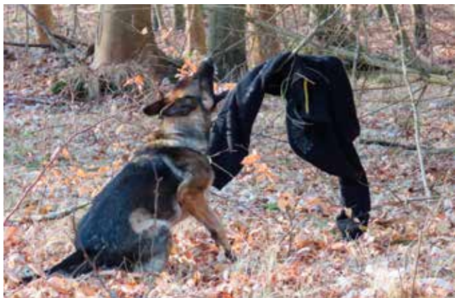
Der blev trænet døde genstande