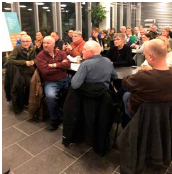
Stor interesse blandt deltagerne ved generalforsamlingen