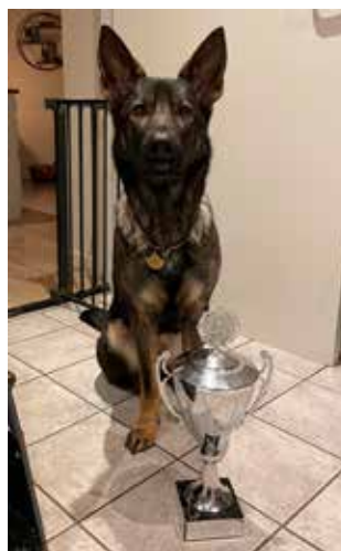
Vi gjorde det!

Et stort TAK til jer, der hjalp os i mål! Ingen nævnt, ingen glemt.