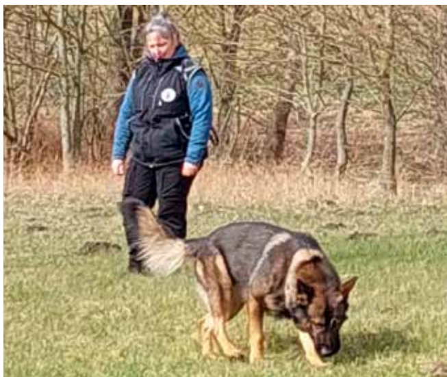
Gerningsstedet gik over alt forventning, 0 fradrag.

Kian køre usædvanligt godt og vi 2 sammen, det er en kæmpe fornøjelse. Der er lidt fradrag hist og her. Ikke som da vi sidste år, hvor vi tog 3. pladsen til Kåringskonkurrencen i Viborg, der var det både hf og hund som tog rigeligt for sig af pointene :-D I Lydighedsøvelserne smuttede der 1,3 p. Jeg var mere end tilfreds.