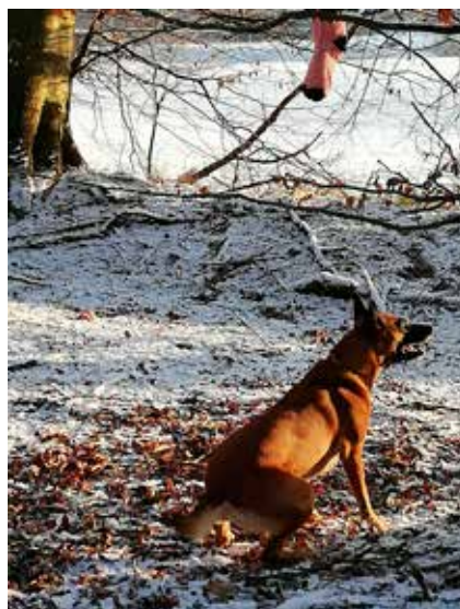
Julesokken fandt Fenja også