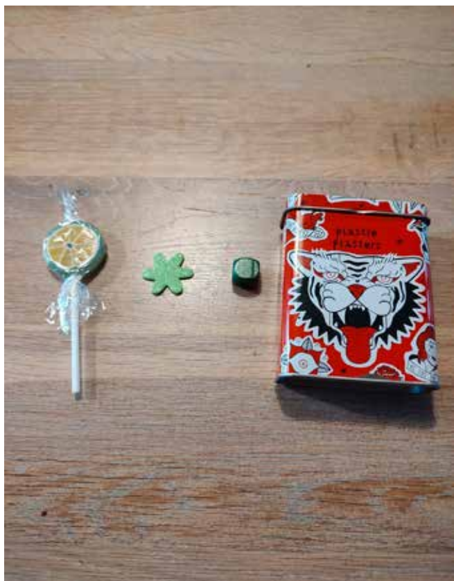
Genstande på sporet + en spade