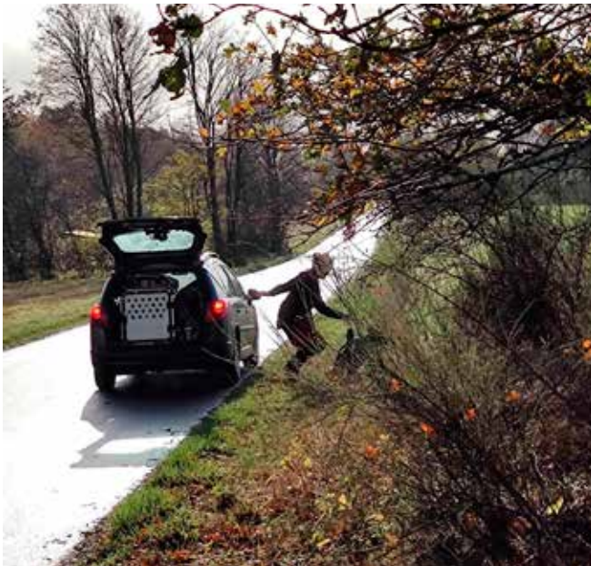
Pauline og Vanja i gang med øvelse 10