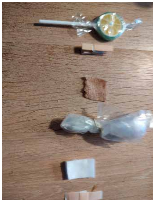
Genstande på gerningsstedet