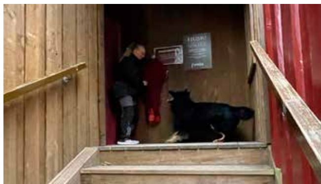
Vinder på rundering