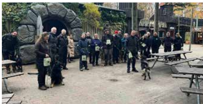
Hundefører og nogle af hundene