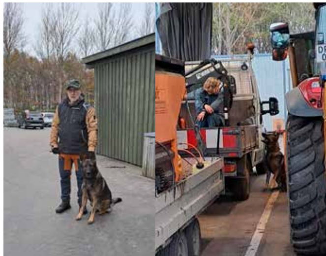
Claus med Cato klar til runderingCantona

på Randers Kommunes Materielgård ved Hvidemøllevej, - og senere som eftersøgningsopgave i skoven.