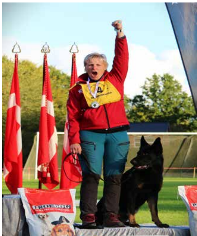
Vi gjorde det!!