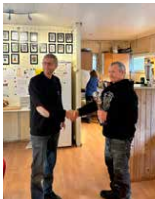
Tonni får pokal for 1. pladsen

Da det kun var PH Dronninglund, som stillede hold, så vandt de hold konkurrencen: