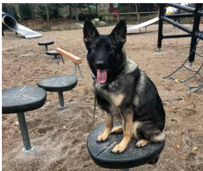
Phibie var også med