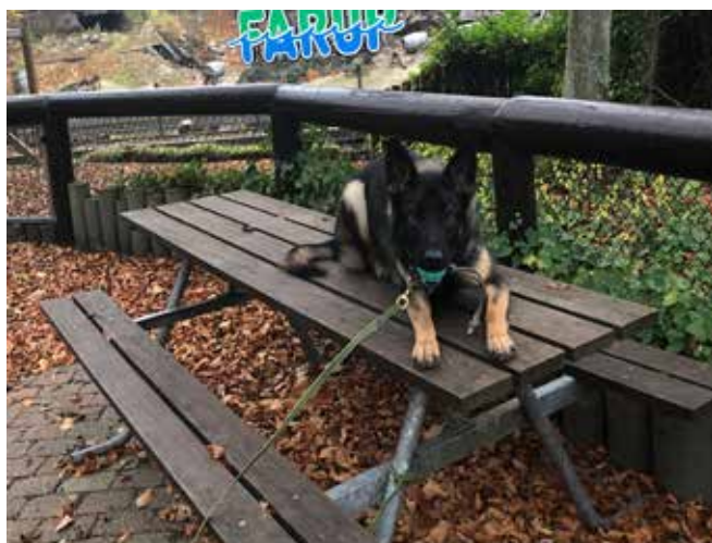
Phibie – ja og hun kan ikke står for de borde og bænke sæt