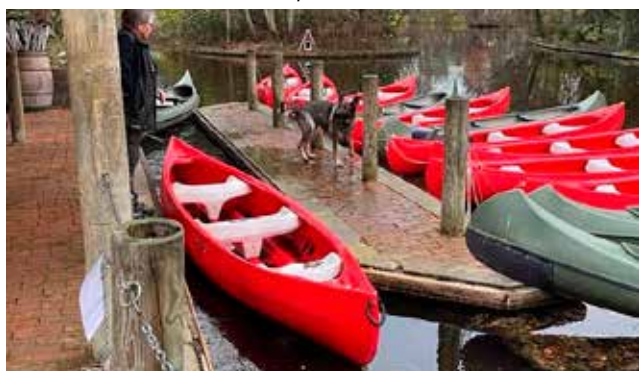
Asti på rundering