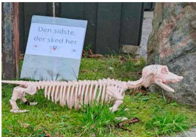
Barsk reglement på området