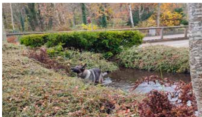
Asti har fundet en genstand i feltet på kanten af vandet