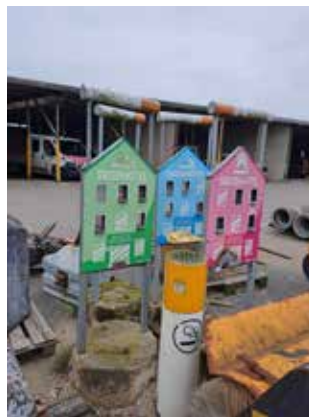
miljøet på pladsen