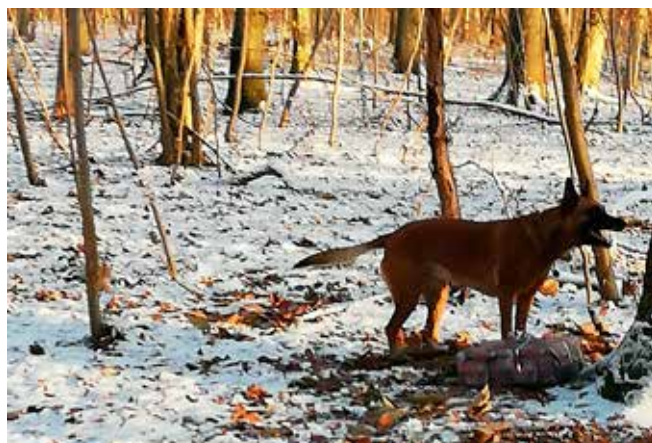
Fenja har fundet den tabte pakke