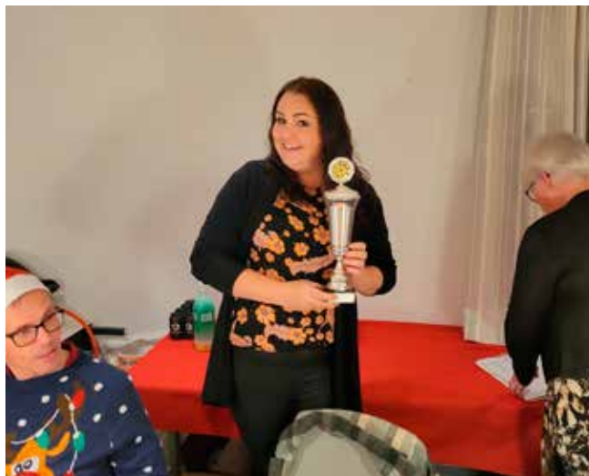
June med sine fine pokal