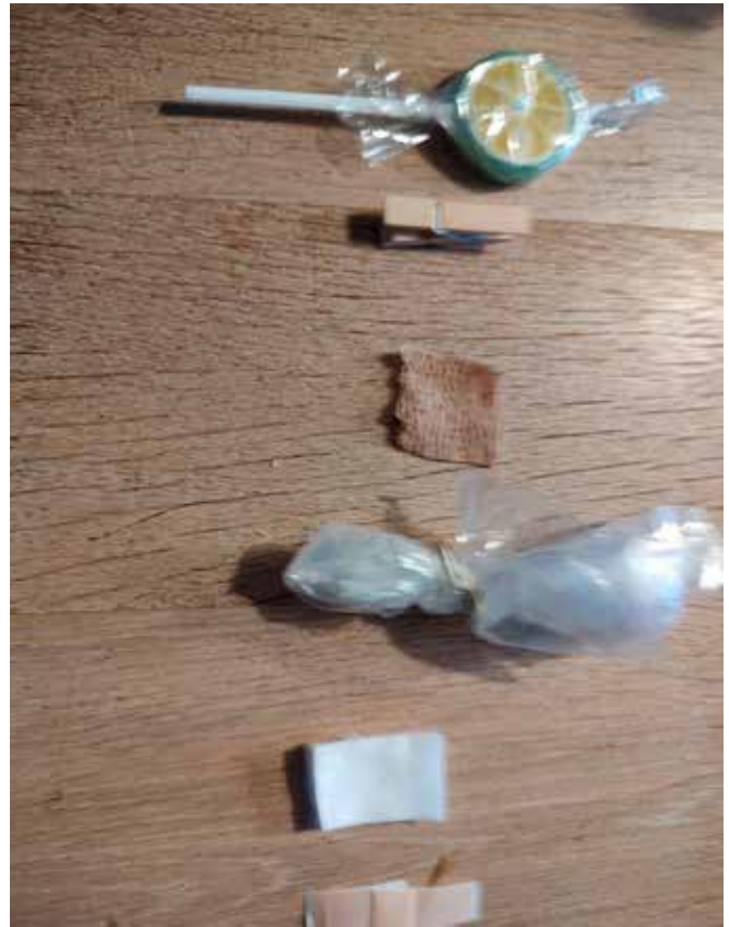
Genstande på gerningsstedet