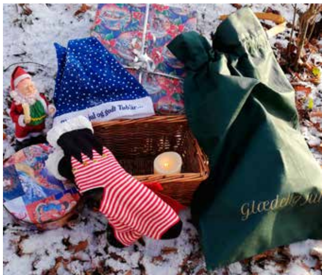
Runderingsgenstandene. Bemærk julemanden øverst til venstre i billedet. Den spiller en skrækkelig skinger melodi.

Og for hvilket år i træk undrer vi os over, at hundene ikke reagerer på den elendige musik, som julemanden sender ud.