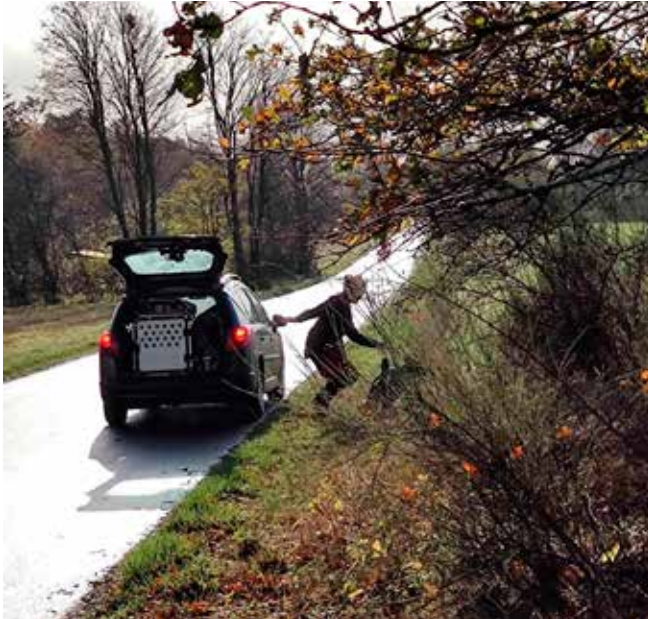
Pauline og Vanja i gang med øvelse 10