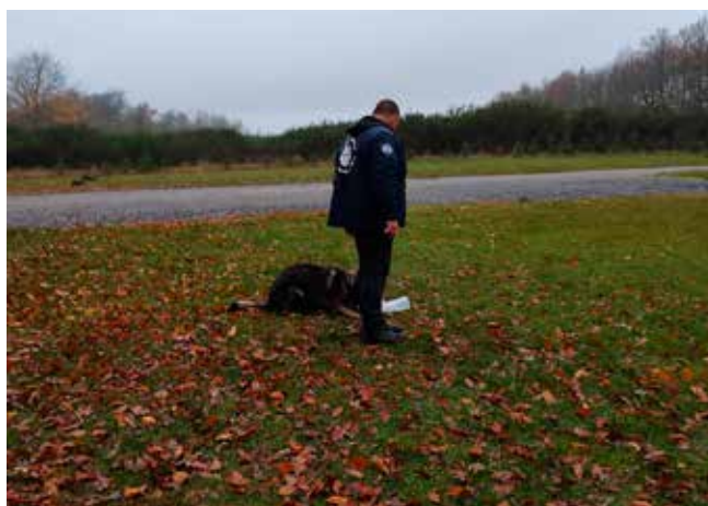
Trump havde en fest med apporten