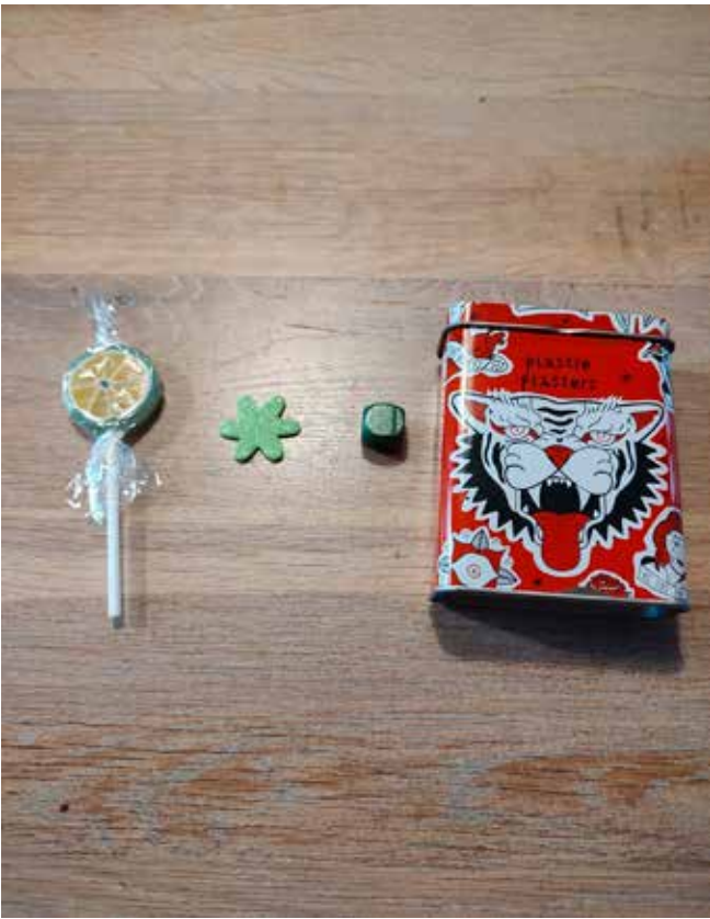
Genstande på sporet + en spade