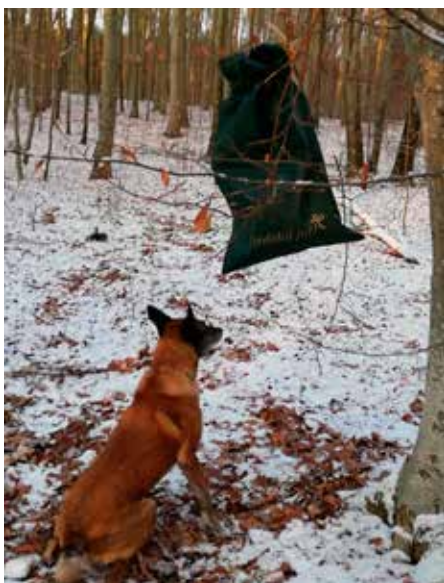
Den store gavesæk blev også fundet