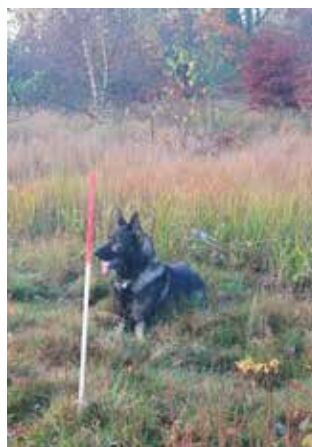
Trump i afdækning