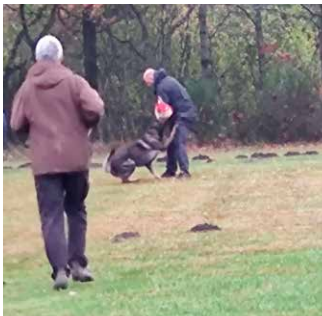
Trump i øvelse 11