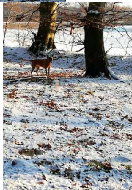
Endnu en julesok fundet