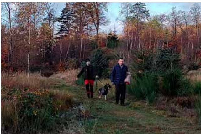
Jeg fangede banditten, men hvor er dommerne