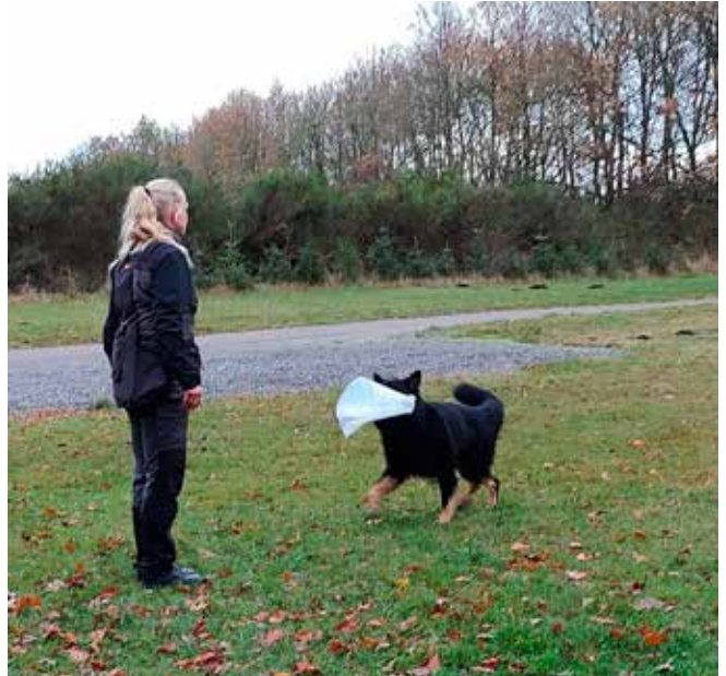
Marianne og vinder med dagens bedste apport