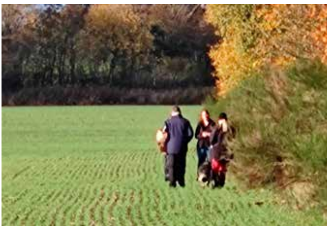
Nå for filan er I der?