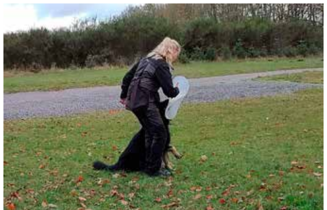
Afslutningen af apport