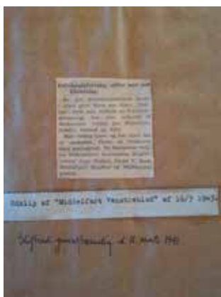
Stiftende gf 11- marts-1943