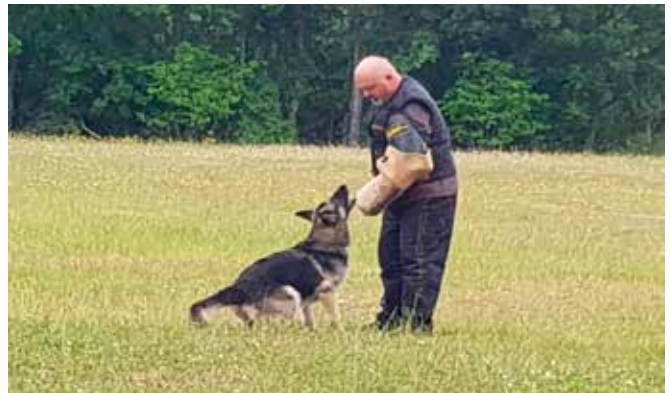
Heldigvis landede hun på jorden