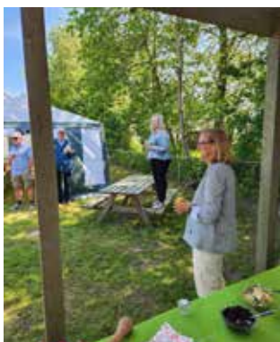
Formanden holder tale