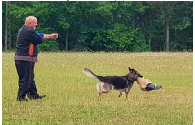
Farvel og tak Hr. Figurant