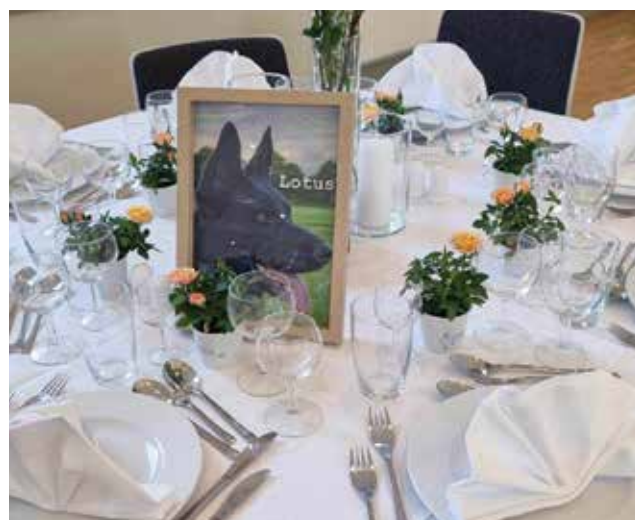
Bord Lotus (To-Fast Lotus)