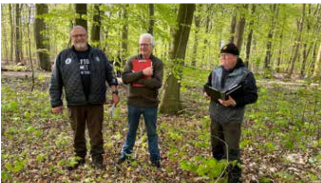
De strenge dommere til oprykningen 2023