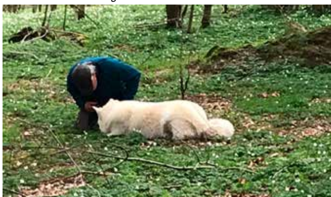
Haslan har fundet en genstand