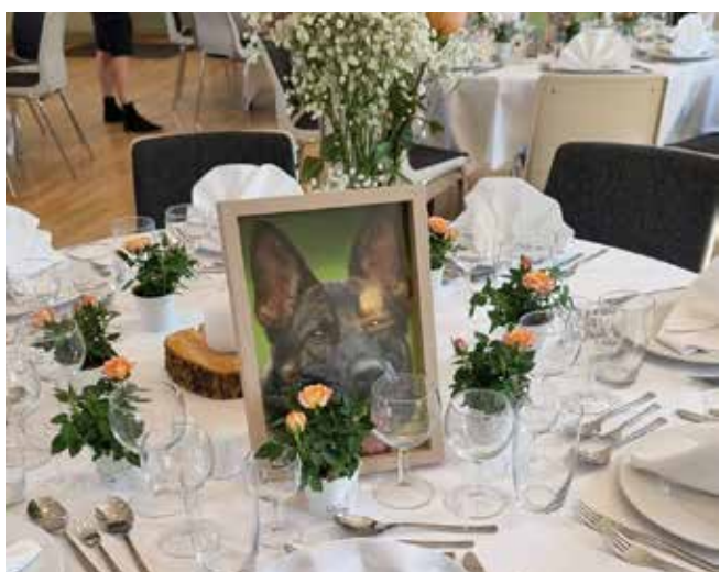
Bord Unni (Amager's Unni)