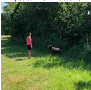
Se hvad jeg fandt