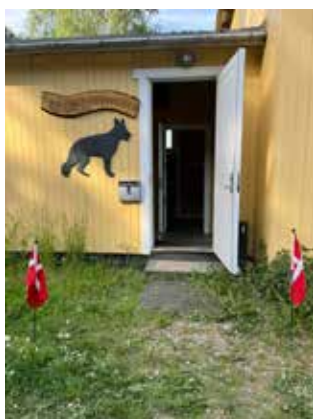
Indgangen til klubben

Der blev afholdt åbent hus på Søbadsvej den 20. maj 2023. Klubben takker for besøg og gaver, og vi glæder os til vores 90-års jubilæum.