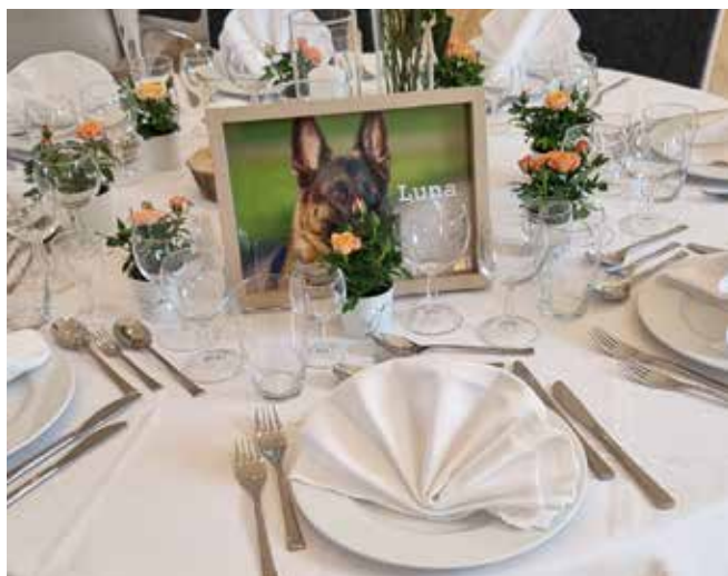
Bord Luna (Amager's Qvalli)