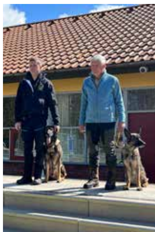
Første og anden vinder på dagen i opryk. krimklassen