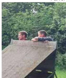
Ja et springbræt kan bruges til meget