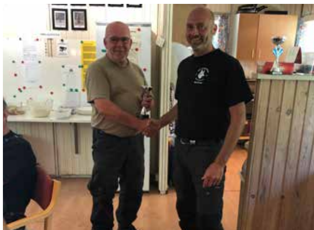
Kent med pokalen for 2. pladsen

Mette Dalsgaard Thomsens m.j.thomsen@klarupnet.dk Tlf 41 93 02 00