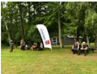
ved at være klar til bid