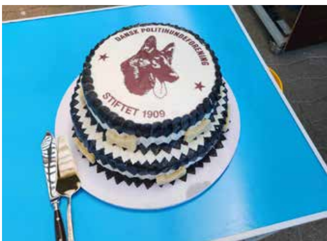
Kagen til kaffen