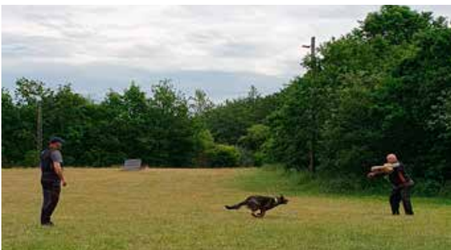
Jimmi og Fuglsangs grå Delta