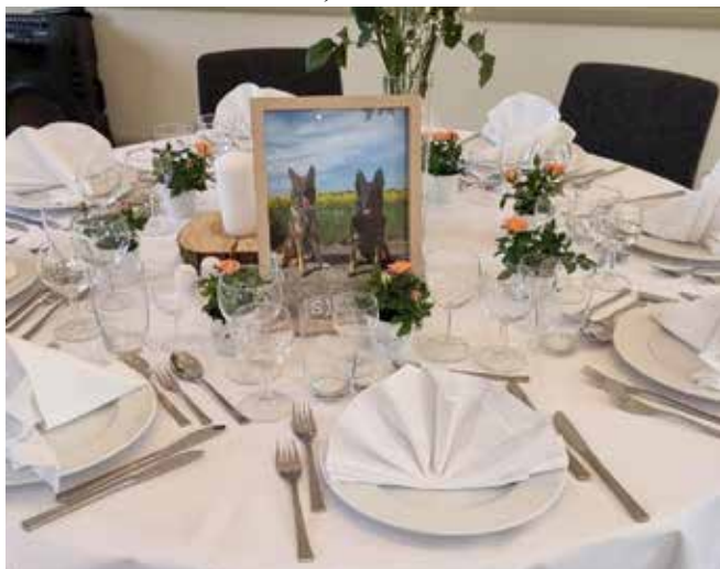
Oya og Soya bordet (Le-Wan's Oya og Schæferhaven Debbi)

Bordene havde ikke numre, men hundenevne.