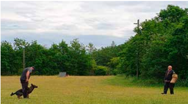
Jimmi og Fuglsangs grå Delta