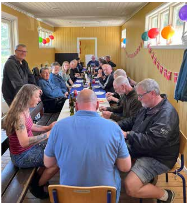
Gæster til festen