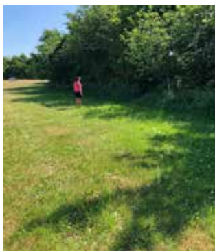
Louise venter på at Dax finder apporten mellem træerne