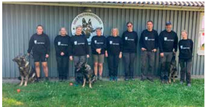
Ja også foran huset