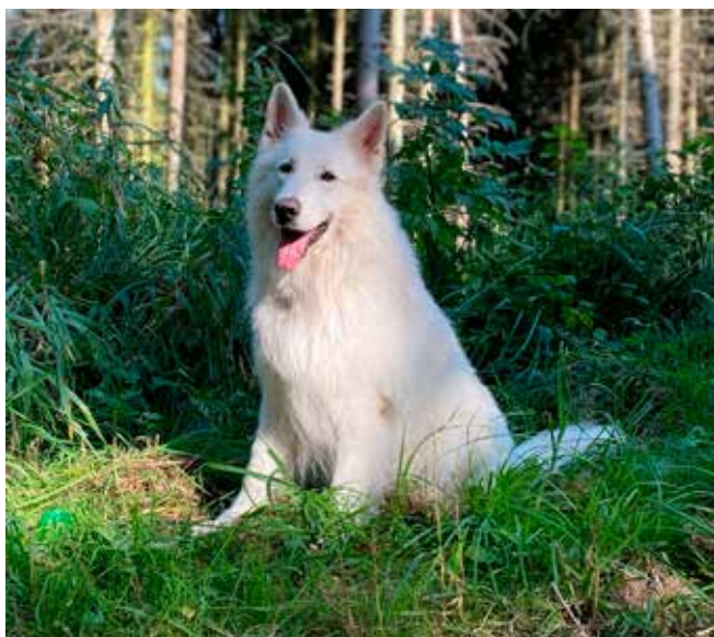
Haslan i Hareskoven ved optagelser