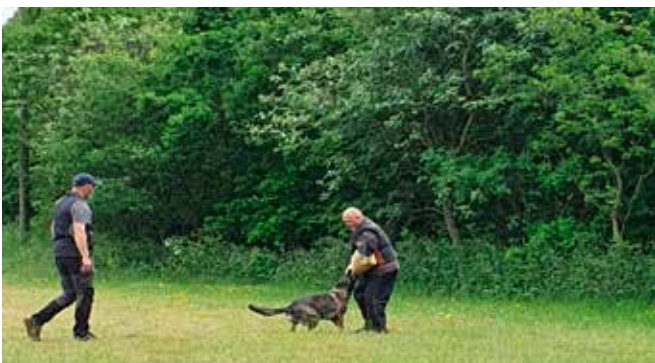
Jimmi og Fuglsangs grå Delta