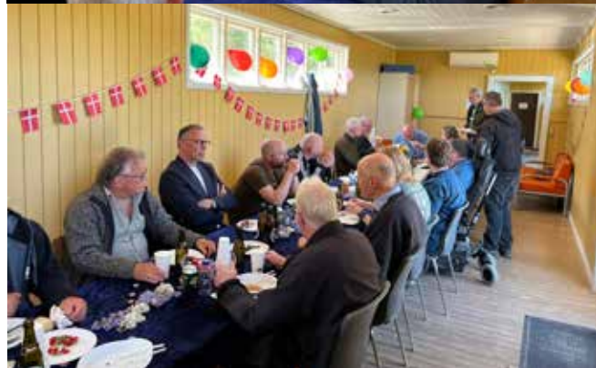
Gæster til festen