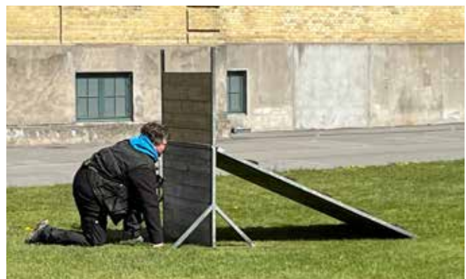
En to tre hop - hf gør sig klar til spring