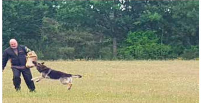
Mollers Gipsy – hun kan flyve, hun kan flyve