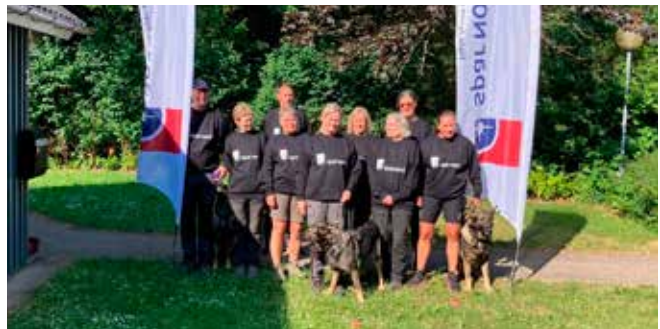
Alle deltagere med de fine trøjer

Stor tak til Spar Nord, som var sponsor af en sweatshirt til alle deltagere.