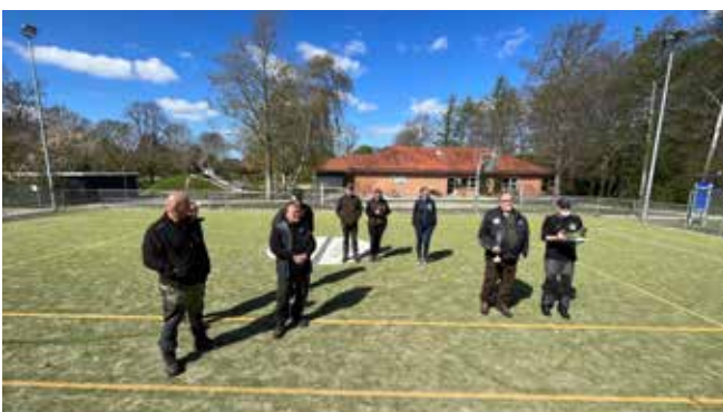
Figuranter, dommere og supportere til krim. oprykning