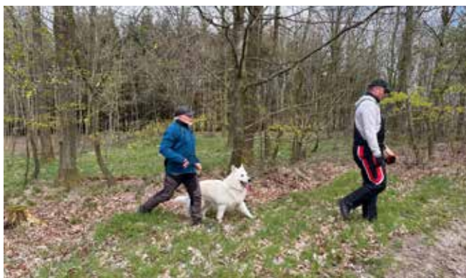
Figurant føres ud af skoven

Filminstruktørerne var meget tilfredse med Haslan, de sagde, at når de har hunde med, er de mange gange nødt til at lave om på scenerne, for at få det til at passe til hunden, men Haslan lavede allescenerne som de var planlagt. Så se efter når Oxen komme i efteråret på TV2.