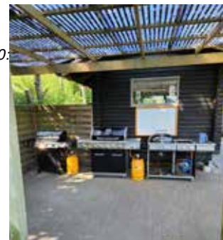
Der bliver gjort klar