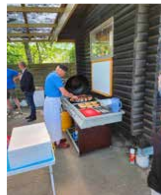
Maden er klar