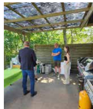
Vi er klar