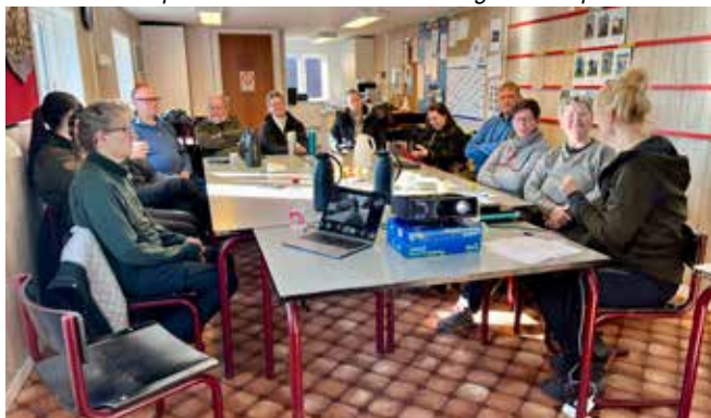
Teori i klubben