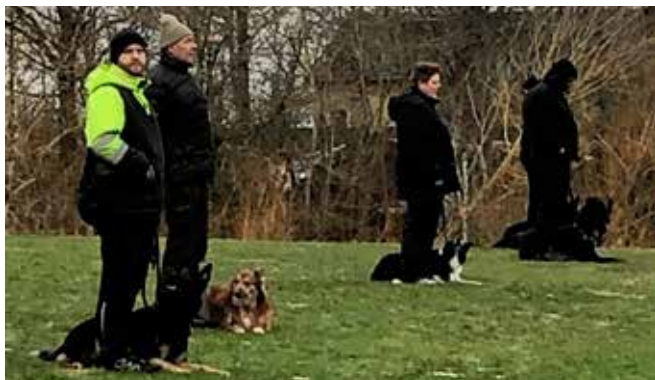
Så skulle vi lave afdækning