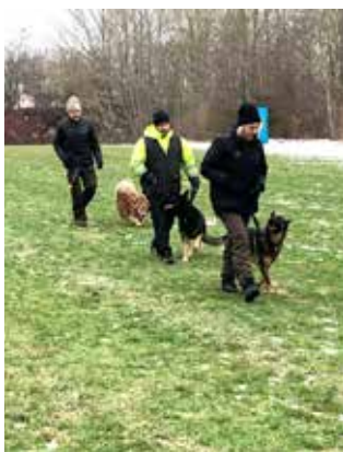
Først gik vi på række