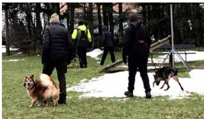
Så var det tak for i dag ...er du med mor?