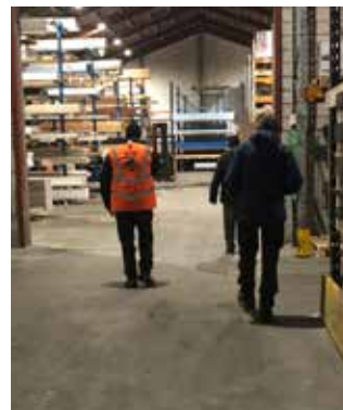
Så er der rundering