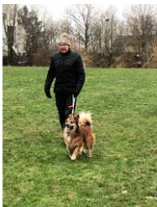
Så skal vi træne sammen med de ”andre” hunde