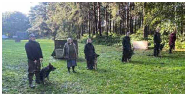
Så er der stillet op til præmieoverrækkelse