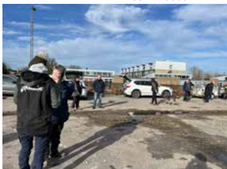
Der kigges på hunde der går asfaltspor