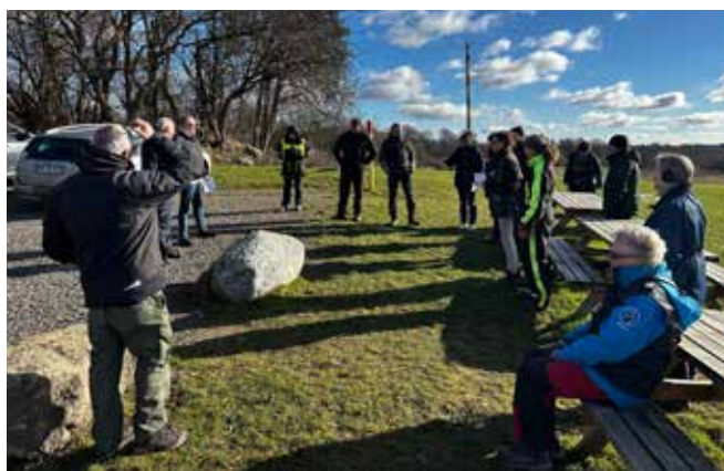
Dagens resultater bliver læst op

Ronny Grønvig med Team Amager's Aint Give A Fuck blev indstillet til prøvekaring.